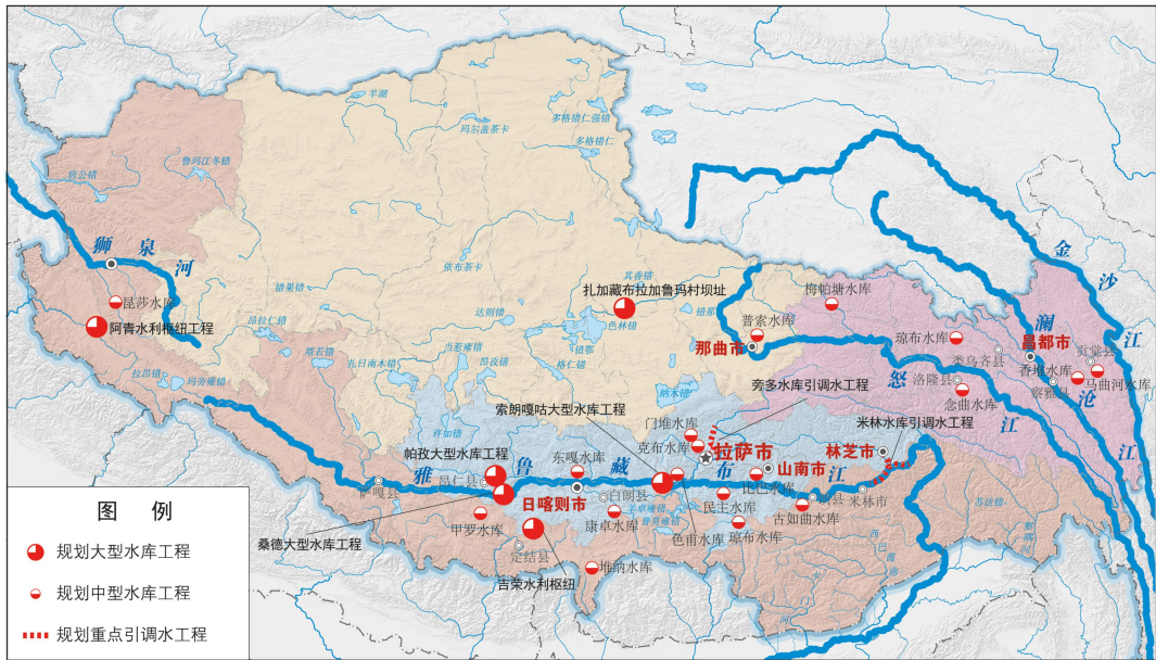
图 3 “四江一河”骨干水网示意图