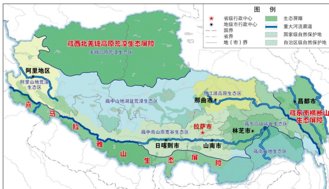
图 4 重点生态功能区格局示意图

荒漠、冰川生态系统修复和保护，提升生态系统质量和稳定性。加强对冰川资源开发建设活动源头管控，保持冰川原真风貌。科学开展大规模国土绿化行动，重点实施拉萨南北山绿化工程，推进营造林“质量保障”体制机制创新。开展城乡绿化工作，努力打造林水相依、林路相依、林居相依的复合生态系统。加强历史遗留废弃矿山生态修复治理力度，持续推进绿色矿山建设。