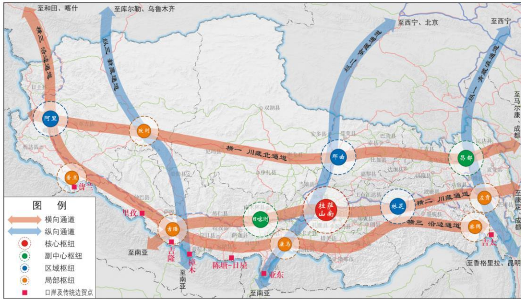
图 2“三横三纵”综合立体交通网主骨架示意图